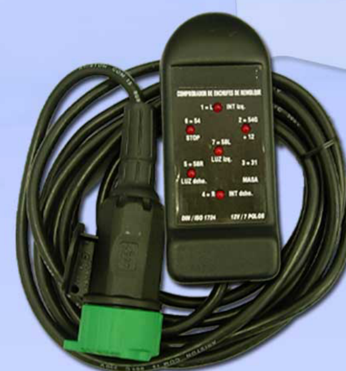
Controller 13 Polos Cable 4 Mts. 0390014