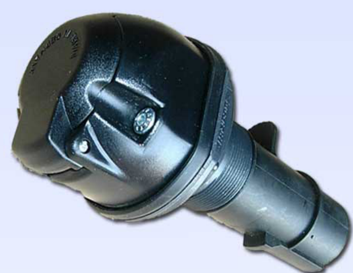
Modelo Compact 300659

Permite el enganche de un vehículo equipado a 24V a otro de 12V sin necesidad de cambiar las lámparas. Equipado con una entrada de 24V Serie N y una Base de 7 Polos 12V estándar.