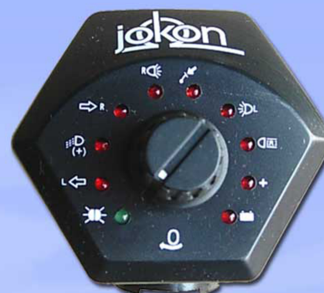
Controller 13 Polos 803919