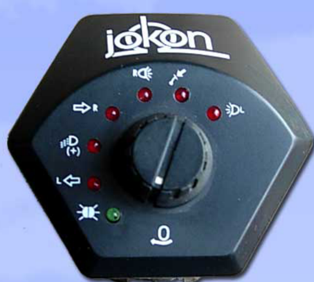
Controller 7 Polos 803918