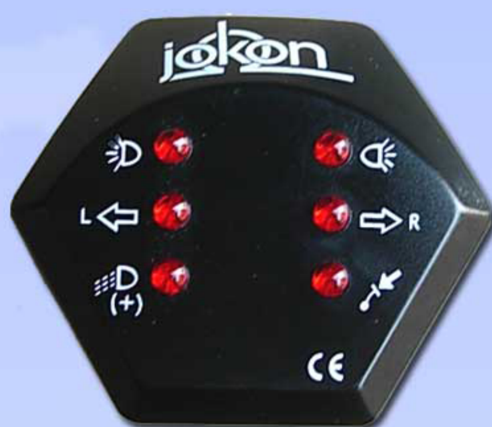
Controller 7 Polos 803940