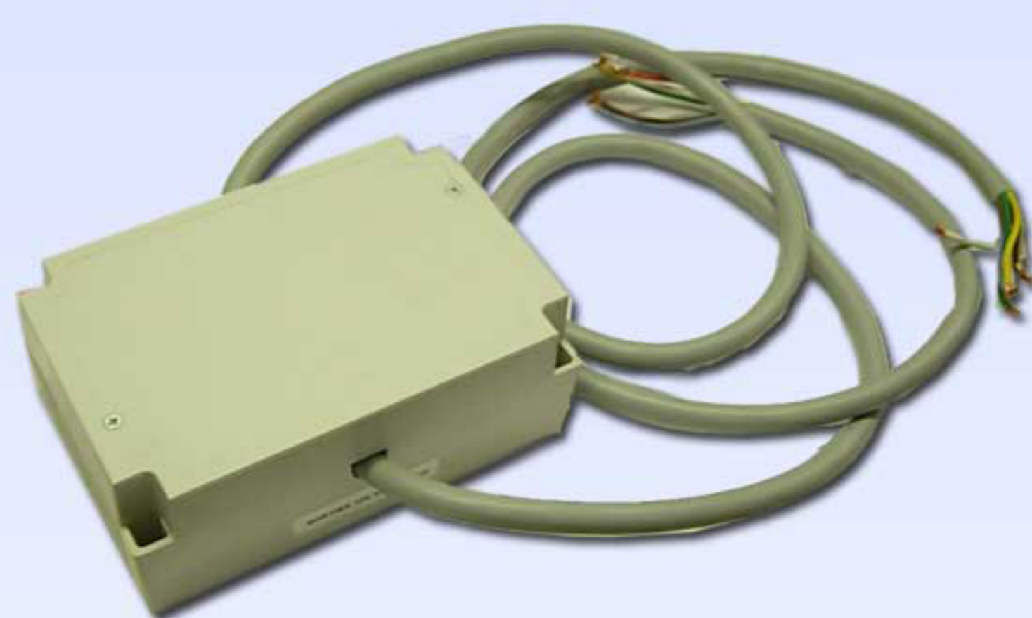
Reductor Tensión 24V-12V 924775