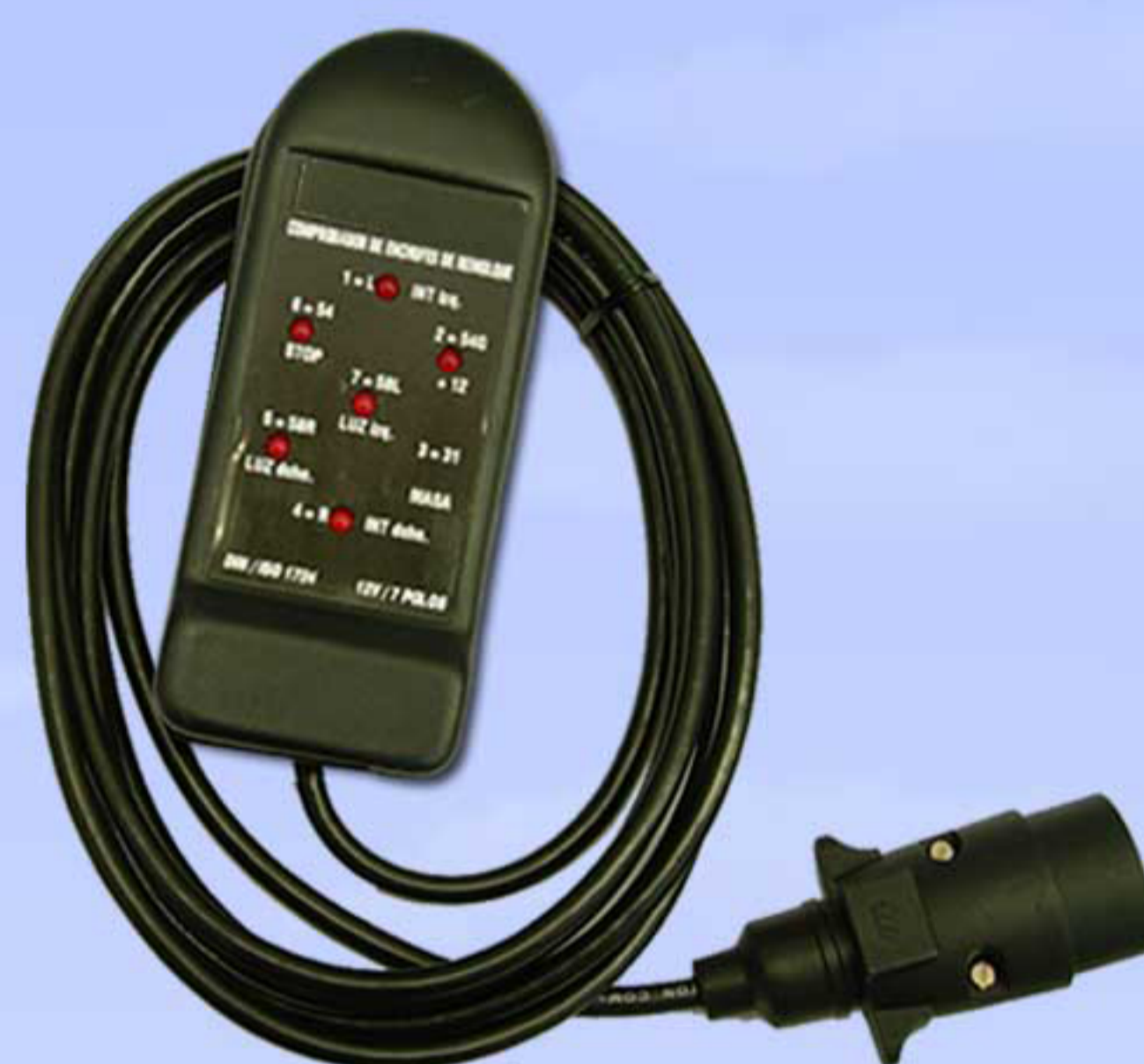
Controller 7 Polos Cable 4 Mts. 0390016