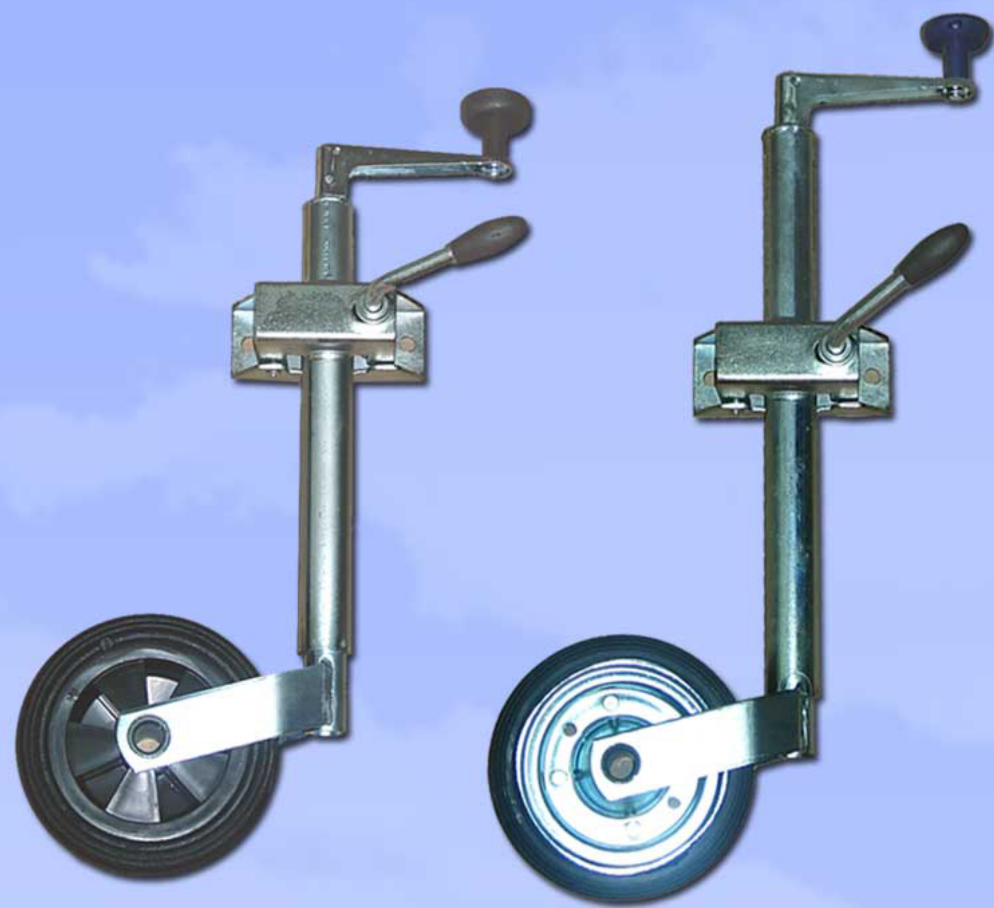
Ø35mm Altura 300 mm